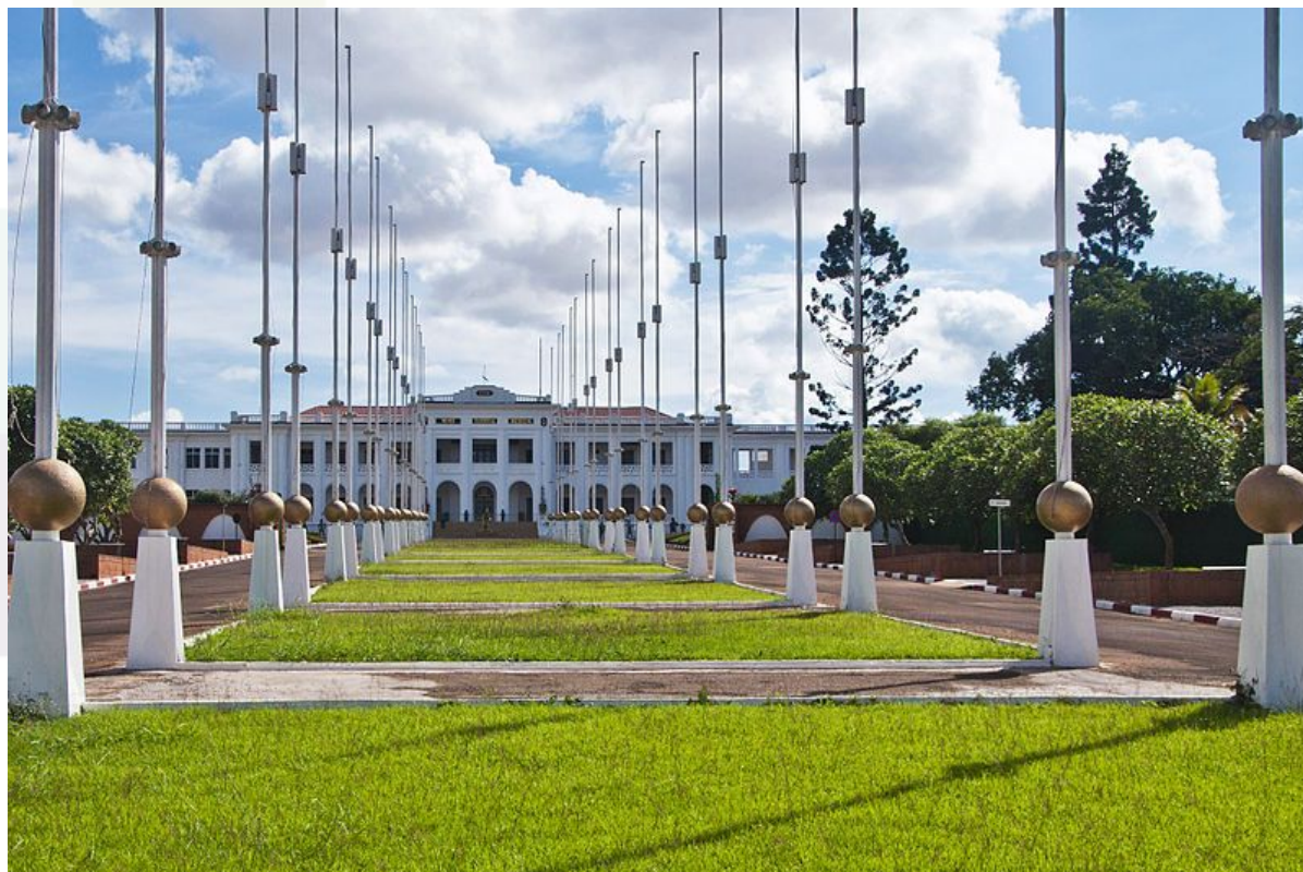
Musée National du Cameroun

À côté des centres culturels nous avons des musées dont le musée national situé au cœur de la ville de Yaoundé aux encablures de la poste centrale tout juste près du palais de justice. Nous vous recommandons les réserves zoologiques de waza à l'extrême-Nord du Cameroun, le parc national de Mvog beti à Yaoundé, le Parc de Limbe au sud-ouest, les chutes de la Lobé à Kribi, les chutes d'Ekoum Nkam dans le Mungo au littoral pour ne citer que ces lieux touristiques.