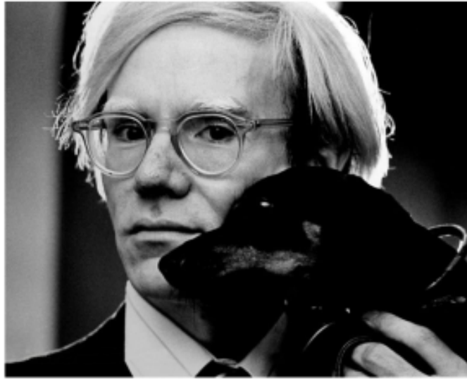
Andy Warhol par Jack Mitchell. CC BY-SA 4.0